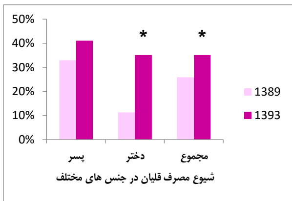
شکل ۱- درصد شیوع قلیان در سال های ۱۳۸۹ و ۱۳۹۳ به تفکیک جنس. علامت * نشان دهنده افزایش معنی دار مصرف قلیان در سال ۱۳۹۳ نسبت به سال ۱۳۸۹ می باشد.