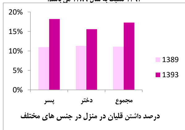
شکل ۲- درصد داشتن قلیان در منزل در سال های ۱۳۸۹ و ۱۳۹۳ به تفکیک جنس