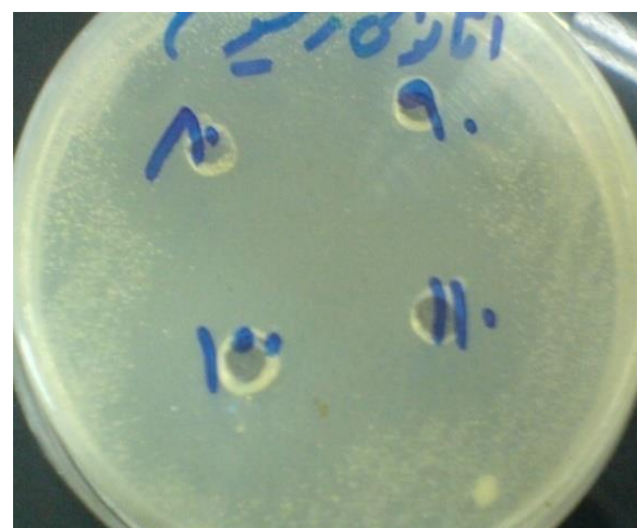
شکل ۳. نتایج قطر هاله ممانعت از رشد در اطراف چاهک حاوی ۸۰، ۹۰ و ۱۰۰ و ۱۱۰ میلی گرم در میلی لیتر از عصاره اتانولی میوه زیتون تلخ به روش چاهک

میانگین قطر هاله عدم رشد برای غلظت های ۸۰، ۹۰، ۱۰۰ و ۱۱۰ میلی گرم در میلی لیتر از عصاره اتانولی به ترتیب 29/66 \pm 2/08 ، 34 \pm 2/64 ، 37 \pm 1 و 40 \pm 1 میلی متر بود (شکل ۳).