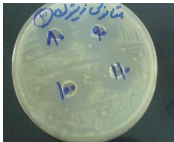
شکل ۲. نتایج قطر هاله ممانعت از رشد در اطراف چاهک حاوی ۸۰، ۹۰ و ۱۰۰ و ۱۱۰ میلی گرم در میلی لیتر از عصاره متانولی میوه زیتون تلخ به روش چاهک

میانگین قطر هاله ممانعت از رشد در اطراف چاهک حاوی ۸۰، ۹۰، ۱۰۰ و ۱۱۰ میلی گرم در میلی لیتر از عصاره متانولی به ترتیب 24/66 \pm 0/57 ، 26/33 \pm 0/57 و 29/33 \pm 2/3 میلی متر بود (شکل ۲).