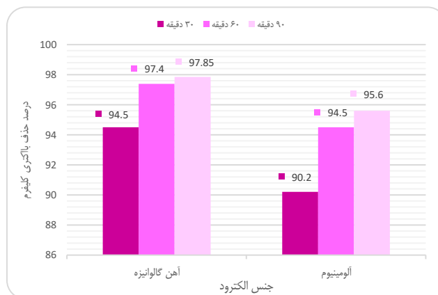
نمودار ۱- مقایسه حذف باکتری‌های کلی فرم توسط الکترودهای آهن گالوانیزه و آلومینیوم در زمان‌های متفاوت (اختلاف پتانسیل ۲۰ ولت)

در نمودارهای ۱ و ۲، اثر الکترودهای آهن گالوانیزه و آلومینیوم بر میزان حذف باکتری‌های کلی فرم موجود در فاضلاب بیمارستانی به روش انعقاد الکتریکی در ولتاژ و زمان تماس مختلف با یکدیگر مقایسه شده است. مطابق این نمودارها، کارایی درصد حذف باکتری‌های کلی فرم در فاضلاب، در مقادیر متفاوت اختلاف پتانسیل الکتریکی و زمان تماس مختلف، توسط الکترود آهن گالوانیزه بیشتر از الکترود آلومینیوم بوده است.